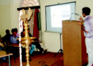
ടൂറിസവും ജൈവവൈവിധ്യവും: തിരുവനന്തപുരത്ത് നടത്തിയ പ്രസന്റേഷൻ

വൈവിധ്യവും എന്ന വിഷയത്തെ അധികരിച്ച്, സംസ്ഥാനത്തെ 14 ജില്ലകളിലും അതതു സ്ഥലത്തെ ജില്ലാ ടൂറിസം പ്രൊമോഷൻ കൗൺസിലുമായി ചേർന്ന് സെമിനാറുകൾ സംഘടിപ്പിച്ചതായിരുന്നു ആഘോഷങ്ങളുടെ ഒരു സവിശേഷത. “കേരളത്തിലെ വിനോദസഞ്ചാരമേഖലയും ഇവിടത്തെ