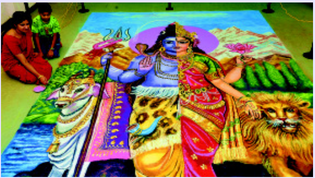
വർണങ്ങളുടെ സങ്കലനത്തിലും, പൊതുവായുള്ള വർണബോധത്തിലും, അനുപമമായ വാസനാ വൈഭവം പ്രകടമാക്കി