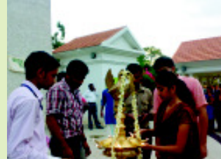
ഗാന്ധിപാർക്കിൽ ദ്വദശിപം കൊളുത്തിക്കൊണ്ട് ആഘോഷങ്ങൾക്ക് തുടക്കമിടുന്നു